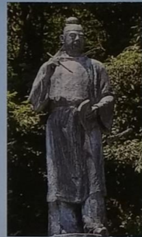
大伴家持像（二上山）

期 日 平成30年10月11日(木)・12日(金) 会 場 富山市芸術文化ホール（富山市オーバードホール）他