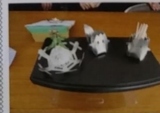
生徒がデザイン・製作した錫製品

現在 株式会社能作 代表取締役社長 公益社団法人 富山県デザイン協会 理事長 一般社団法人 日本工芸産地協会 副会長