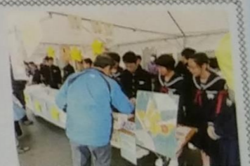
中学生による商品販売

高岡市の中学生が、「能作」と協力して模擬会社を設立。錫製品の企画・デザインから告知、セールス、販売に至るまで生徒自身が考えて取り組む。(文部科学省指定「起業体験推進事業」)